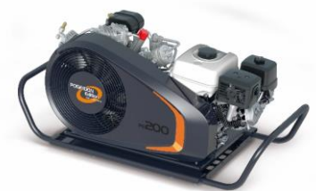
PE200-TB mit Tragegriffen

Die optionalen Tragegriffe ermöglichen einen einfachen und komfortablen Transport.