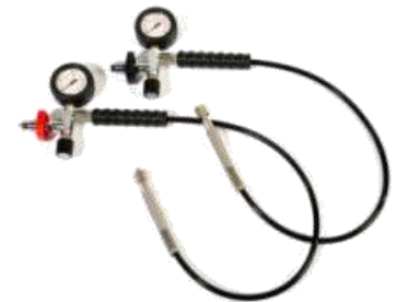
Fülleinrichtung PN200 bzw. PN300

Hochwertige Hochdruckfüllschläuche aus lebensmittelechtem und langlebigem Schlauchmaterial sorgen für eine flexible und sichere Handhabung. Schwenkbare Schlauchanschlüsse ermöglichen den schnellen, einfachen und sicheren Anschluss des Füllventils an die Atemluftflasche.