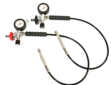
Fülleinrichtung PN200 bzw. PN300