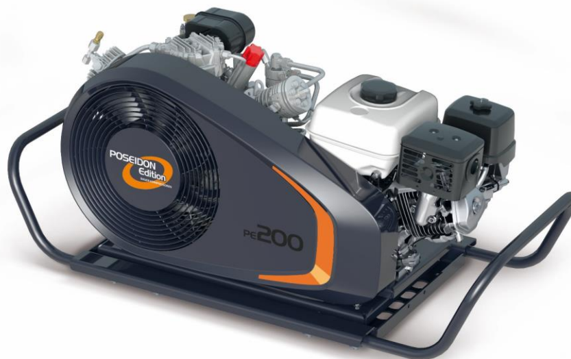
PE200-TB mit Tragegriffen (Sonderausstattung)